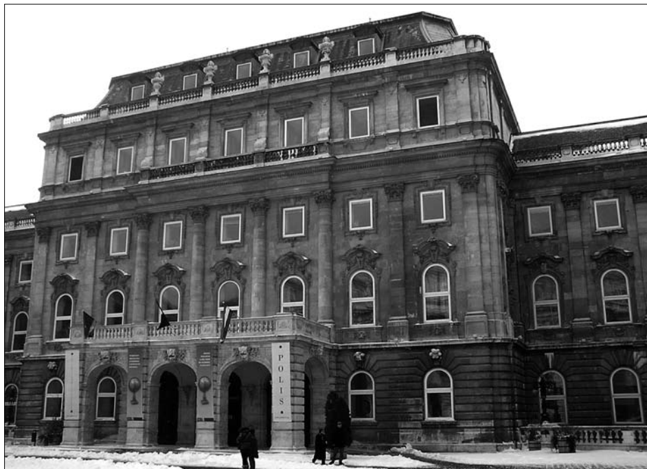
Národní Széchényiho knihovna v Budapešti