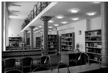
Knihovna Andrassy Gyula v Budapešti

V tomto strategickém období (2008-2013) přispívá Evropská unie značnou částkou k realizaci komplexního rozvoje knihoven v Maďarsku. Vláda schválila v rámci struktury Nového plánu rozvoje Maďarska dva hlavní programy: Operační program sociální infrastruktury a Operační program sociální obnovy . Hlavní cíle obou jsou velmi úzce spjaty se vzděláváním a učním: s koordinovaným rozvojem infrastruktury služeb knihoven, s poskytováním kvalitního vzdělání a zajištěním přístupu pro všechny.