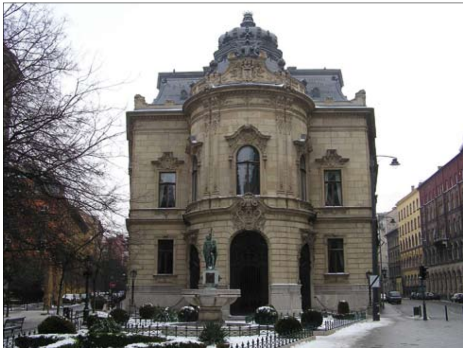
Metropolitní knihovna Ervina Szabó v Budapešti