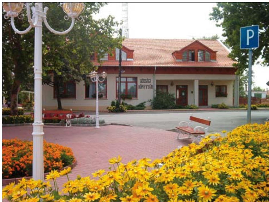
Obecní knihovna v Csemő