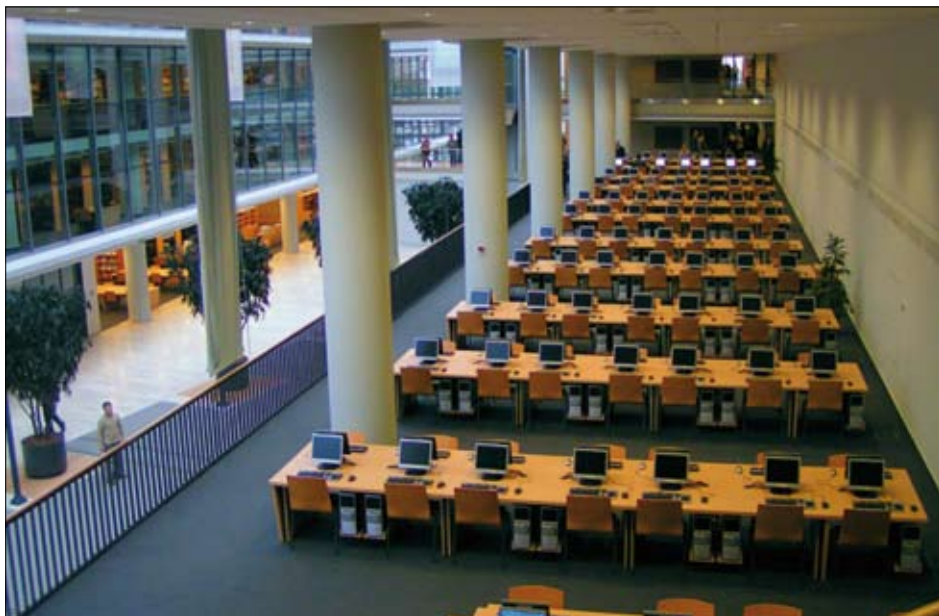
Univerzitní knihovna v Szegedu