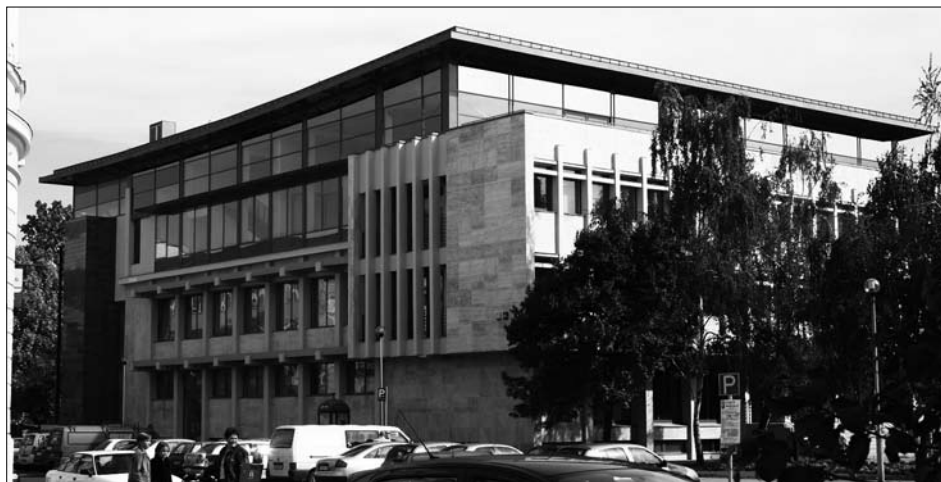
Knihovna Mórócze Zsigmonda v Nyíregyháza

EPA je bibliografická databáze, která shromažďuje, archivuje a zpřístupňuje maďarská elektronická periodika a periodika vztahující se k Maďarsku volně dostupná na internetu nebo serverech státem financovaných vysokoškolských nebo vědeckých institucí a knihoven. Těmito zdroji mohou být digitální verze tištěných periodik