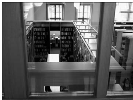
Knihovna Ference Rákocziho II

sátých měly na vysokoškolské knihovny značný vliv. Počet studentů v institucích vyššího vzdělávání během posledních deseti let dramaticky stoupl, což se odrazilo v nebývalém zvýšení využití fondů a služeb vysokoškolských knihoven. Rozvoj akademických institucí byl také ovlivněn procesem integrace univerzit a vyšších škol, který začal koncem devadesátých let. Slučování institucí přineslo vysokoškolským knihovnám mnoho problémů jak na organizační, tak také provozní úrovni a vyžádalo si vyšší úroveň sdílení zdrojů a spolupráce. Vysokoškol-