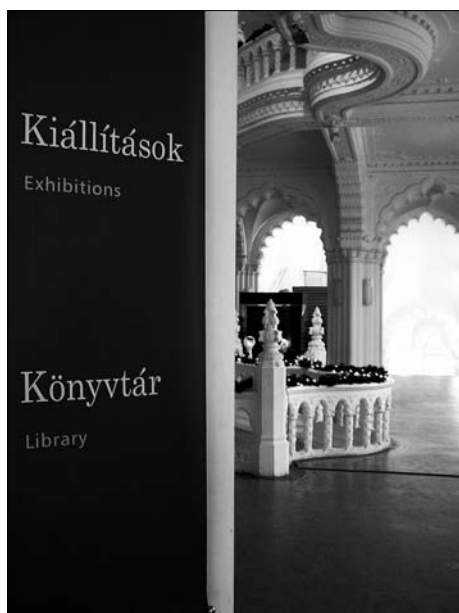
Knihovna Uměleckoprůmyslového muzea v Budapešti

Až do konce devatenáctého století získával personál maďarských knihoven nezbytné znalosti a dovednosti pouze v rámci každodenní praxe. První školení v oblasti knihovnictví se uskutečnilo v roce 1898 a četné kurzy byly pak pořádány v období mezi dvěma světovými válkami pro personál nejdůležitějších maďarských knihoven a další občany, jejichž vzdělání se opíralo o humanitní vědy a chtěli svou kariéru spojit s prací v knihovně.