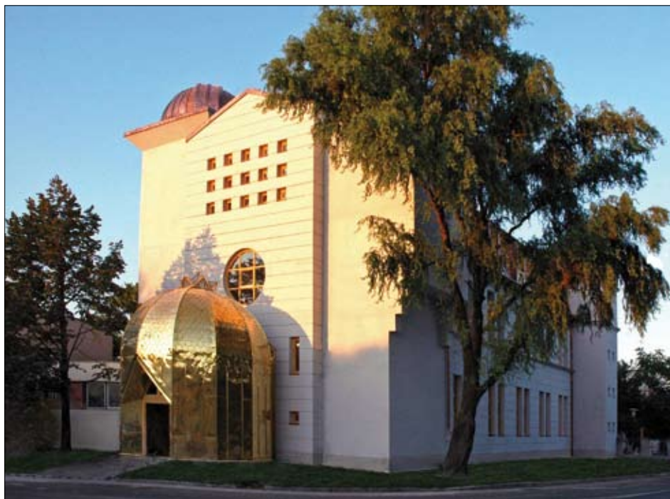
Městská knihovna v Jászberény

Na obálce Národní Széchényiho knihovna v Budapešti